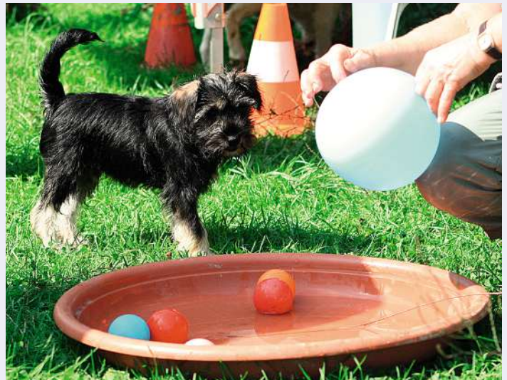
Erlebnisse dosieren: Mit einem kleinen Parcours im Garten den Horizont des Welpen erweitern – aber stets genügend Erholungszeit einplanen!