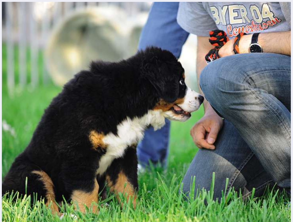
«Ich gehöre zu Dir»: Während der ersten Wochen geht es vor allem darum, das Vertrauen und die Beziehung, respektive Bindung zum Besitzer zu fördern und zu vertiefen.

Einen wichtigen Beitrag leistet in dieser Phase die Welpengruppe. Diese erfasst die letzten Wochen der eminent wichtigen Sozialisierungsphase und hat zum Ziel, die