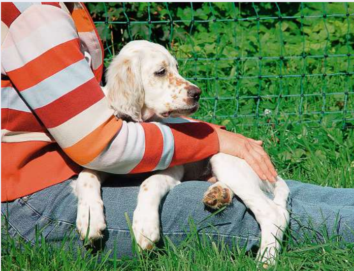
Nähe schafft Vertrauen: In den ersten Wochen hat der Kleine genug zu tun mit den Gerüchen und Eindrücken der neuen Umgebung.

Wer noch nie einen Hund gehalten hat, muss gemäss Tierschutzverordnung vor der Anschaffung einen Theoriekurs von mindestens vier Lektionen besuchen. Danach folgt ein Praxiskurs mit Hund von ebenfalls mindestens vier Lektionen, der für sämtliche Hundehalter, die sich einen neuen Hund anschaffen, zwingend ist. SKN-Kurse dürfen nur von Personen mit BVET-anerkannter Ausbildung angeboten werden. Zu den anerkannten Ausbildungsstätten gehört auch die SKG. www.skg.ch